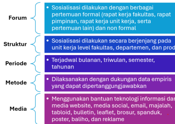
Gambar 1. Kerangka Sosialisasi Renstra FMIPA UNY 2023-2026