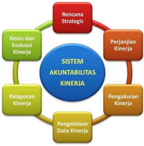
Gambar 2. Komponen SAKIP